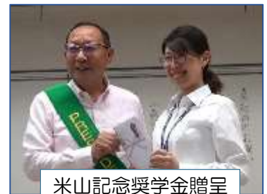
米山記念奨学金贈呈

また、古河に来ることが出来てすごくうれしいです。去る 18 日 (土)、19 日 (日) 米山梅吉記念館に行ってきました。初めて伊豆の方へ行きました。すごく楽しかった。一泊二日で 1 日目は、米山梅吉記念館に行っ