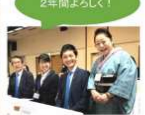
顧問カウンセラー