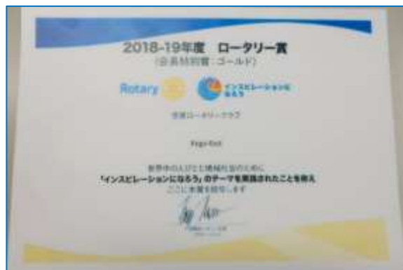
山崎清司パストガバナーから古谷弘之 2018-19 会長へ