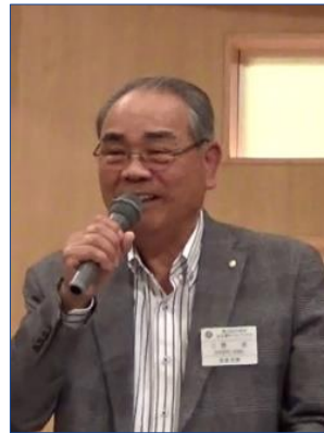
久野衛星クラブ代表世話人