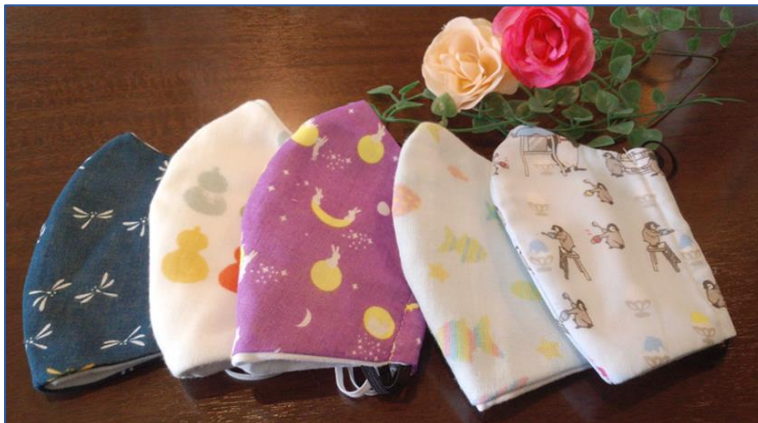
「愛情たっぷり手作りマスク」