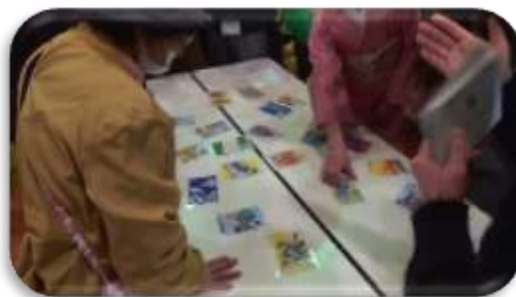
古河東ゆきはなロータリー衛星クラブのブース