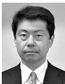
国際ロータリー2820地区 インターアクト 委員長