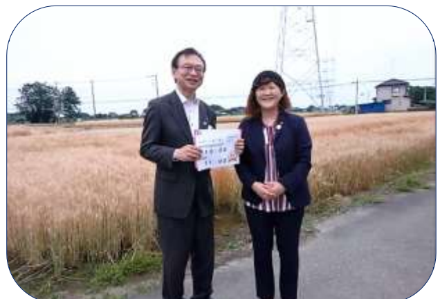
公式LINE配信用動画撮影中の会長幹事 (撮影場所：五霞町 とある麦畑にて)