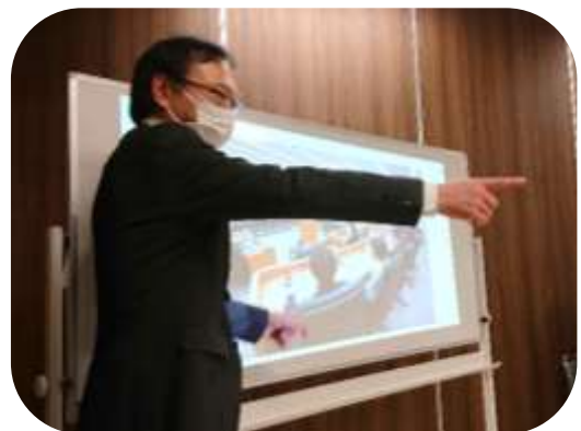
「子ども模擬裁判」の様子