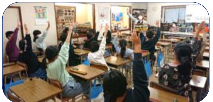
こもりやスクール 授業風景

そして、そろばんも今はタブレットそろばんも使うようになっていきます。お孫さんとの会話でこのような経験がある方も多いと思います。青少年奉仕で子どもや学生と交流する際、あらかじめ知っておくと良いのかなと思います。