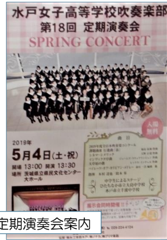
水戸女子高等学校定期演奏会案内