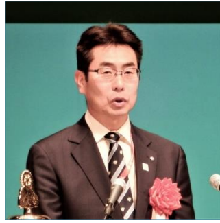
宇野善昌 茨城県副知事