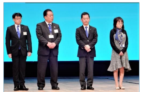
江口紀久江地区ローターアクト委員