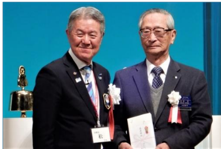
最長寿会員表彰 1922 年生まれ