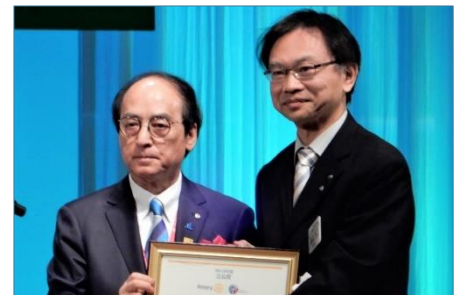
RI会長賞受賞 古河東クラブ