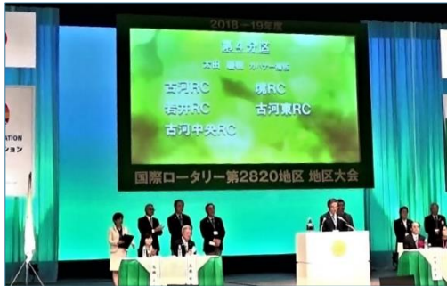
参加クラブ紹介 第4分区