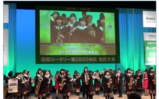
ウェルカムプログラム