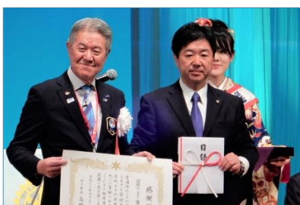
記念事業目録贈呈 水戸市長へ