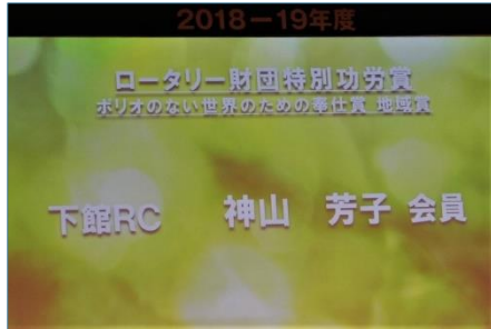
ポリオのない世界のための奉仕賞