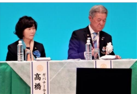
高橋賢吾ガバナー夫妻