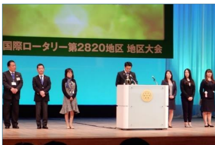
ローターアクト紹介と活動報告