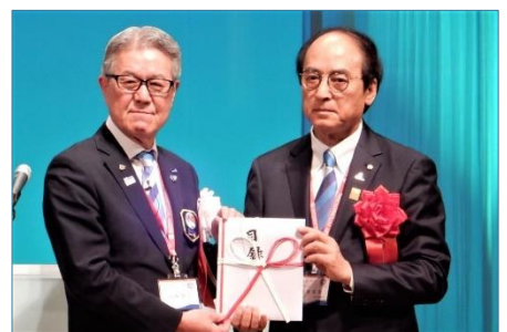
ロータリー財団へ