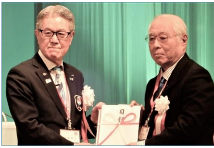
ロータリー米山記念奨学会へ