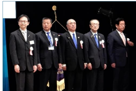
RI会長賞 5クラブ 古河東クラブ