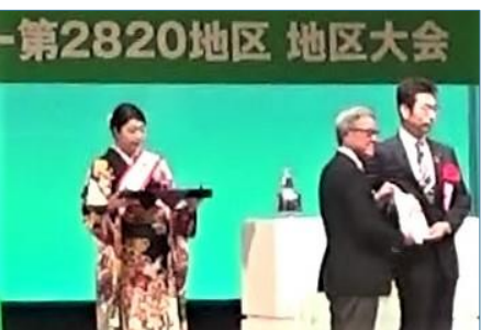
記念事業目録贈呈 茨城県知事代理へ