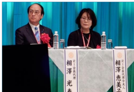
相澤光春 RI 会長代理夫妻