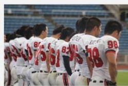
4 年次、入れ替え戦で敗戦。2部降格