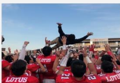
3 年次、1部リーグ昇格。副主将へ