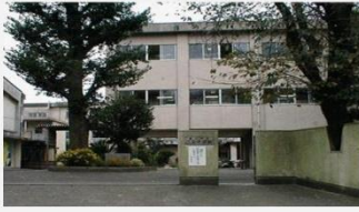
野球部で、やっぱり藤沢市で3位