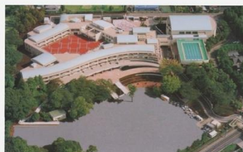
藤沢市立 六会小学校