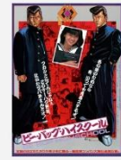
ビーバップハイスクール