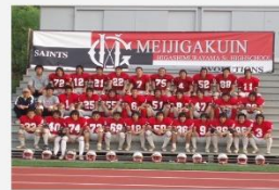
明治学院大学セインツ