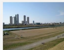
昼は大田区、鶴のモグランド