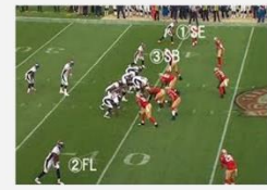
ポジションはワイドレシーバー