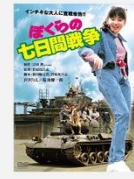
映画「七人の七日間戦争」