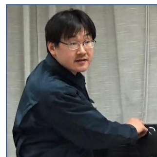
それこそロータリー