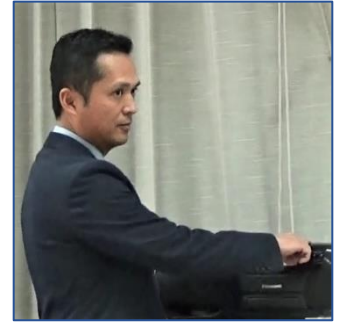
四つのテスト、古河東ロータリークラブソング オーディオ担当